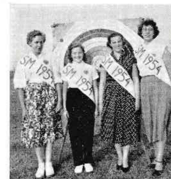
Gripens S-M-värdinnor i Malmö

Tävlingsplats blir Limhamnsfältet, Malmö största fritidsområde. Fältet är 2 km. långt och sträcker sig längs Ribersborgs badstrand.