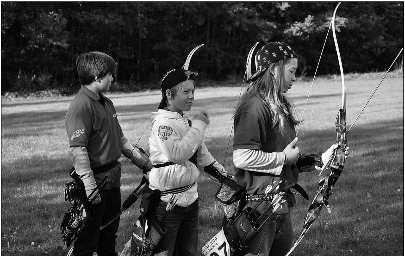
Vad gör vi för våra ungdomar?