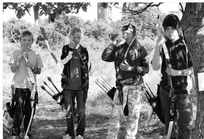
Bilden har inget med insändaren att göra.

Av alla årets genomförda skogstävlingar jag sett resultatlistan på är tendensen klar. Vit och svart påle har varit för svårt lagda. Det är bara att jämföra resultatet på bästa 10 och 13-klassare, i klassiskt och fristil, med motsvarande i HC21. Den bästa 10-klassaren, eller 13-klassaren, i fristil och klassiskt, bör kunna skjuta lika många poäng som den bästa i HC21.