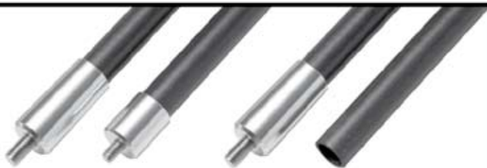
Kolfiberstabbar 8" till 40" • V-bar • Vikter