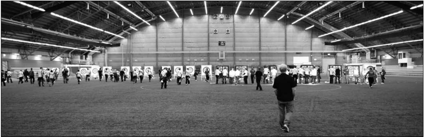
Premiär i den stora hallen för nya compoundronden över 50 meter.

Det som från början startade som ett landslagsläger 2007 har nu utvecklats till en välbesökt fullavståndstävling inomhus med 94 deltagare. Genesis Silver (70 meter och nya 50-metersronden) och Golden Arrow (1440-ronden) bjöd i år på en hel del nyheter. Nu fanns den nya 6-ringade tapeten och den nya 50-metersronden för compound fanns på programmet. Vidare testades ett nytt "App-baserat" resultatredovisningssystem (det var ett nytt ord), se särskild artikel.