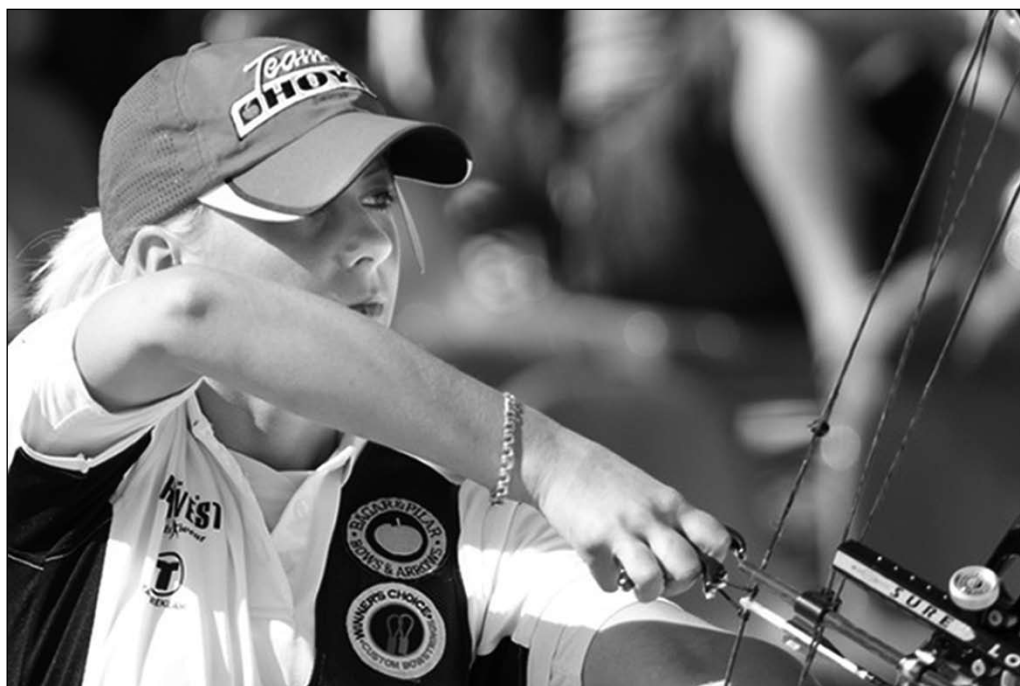
Isabell i full koncentration.

TEXT: MIKAEL SVAHN