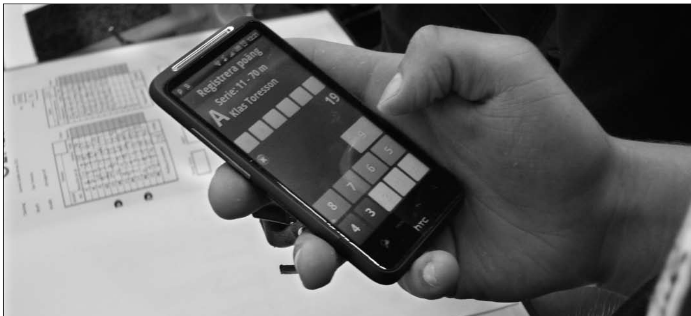
Med den efterlängtrade resultatrapporteringen via mobilen frågar sig skribenten om inte är framtiden redan här.

Under påsken uppe i norr såg vi något som man längtat efter länge inom bågskytten. En spännande tävling för publiken!!