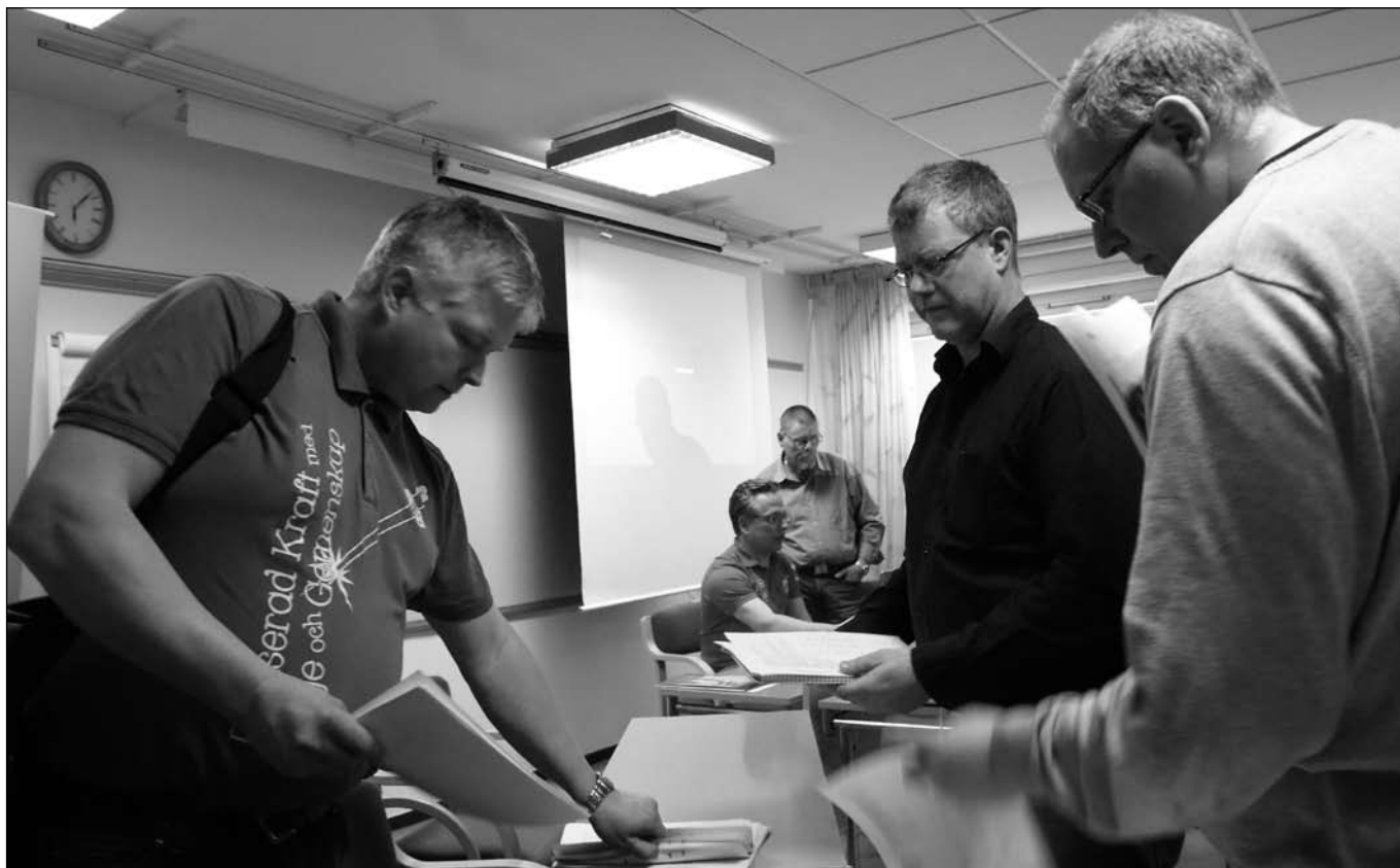
Handlingarna gick åt till årsmötet.

I mitten av april genomfördes förbundets årstämma på Scandic Hotel i Södertälje. Ett 30-tal ledamöter var samlade vilket får ses som ett normalt antal. Dock saknades bland annat ett så stort distrikt som Skånes BF. SISU närvarade och pratade kring frågan om föreningsutveckling.