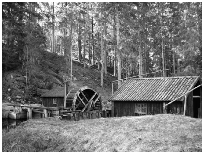
Vackert och kuperat lovar gott.

Efter att Motala / Mjölby nekades 3D-SM kontakades BK Björnen av Västbo bågskytteklubb.