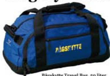
Bågskytte Travel Bag, 50 liter