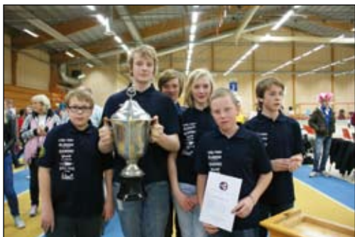
Järnvägens IF (bilden) har nu fått lämna över ledningen till Nykvarn.