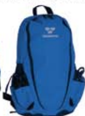
Bågskytte Backpack, 22 liter