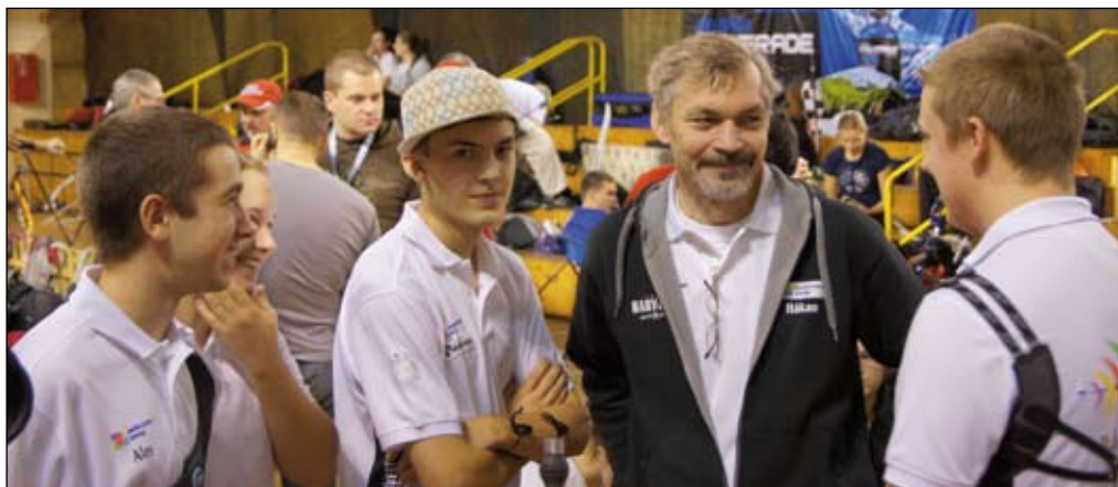
Glada miner trots den sena timmen. Från 2011.