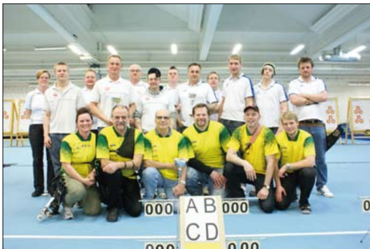
Efter Lindomes seger 2010-2011.