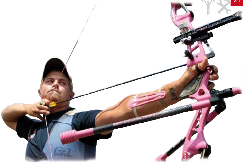
Brady Ellison, USA.

Dels från förbränningsprocesserna där energirika ämnen förbränns med hjälp av syre (aeroba processer), dels från icke syreberoende processer (anaeroba processer).