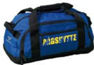
Bågskytte Sport Bag 35 liter