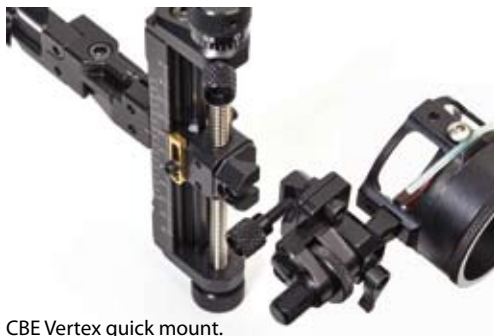
CBE Vertex quick mount.