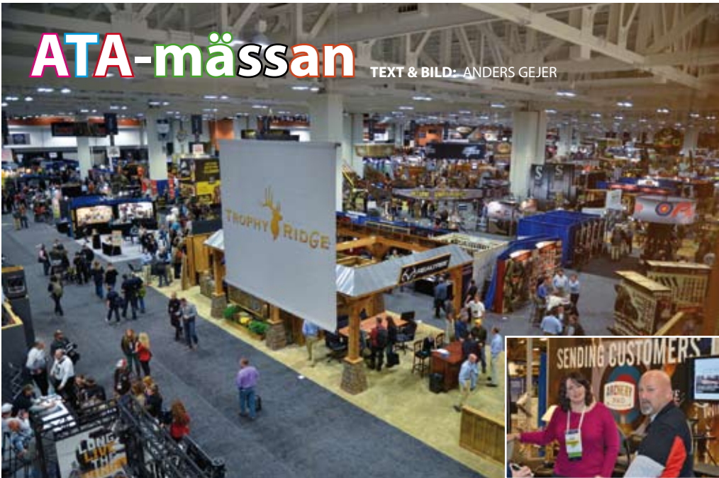
Världens största bågskyttemässa.