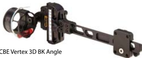
CBE Vertex 3D BK Angle