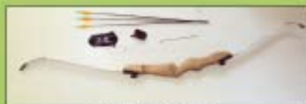
Delar ej utbytbara.