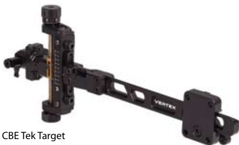
CBE Tek Target

- TEK Target har uppgraderats och är ett nytt sikte, som tidigare Rapid Drive vred för höjjustering. Mer på: www.custombowequipment.com .