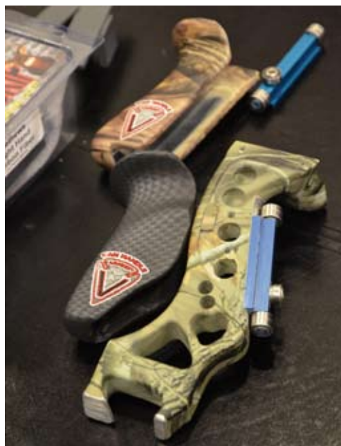
Båggrepp från Van Handel Archery.

- Vertex ersätter CBE's tävlingssikten, som tidigare stabila och precisa med nytt snabbfäste för scopet, den kommer i två längder på siktskalan 2” eller 50 mm eller 3” 76 mm för bågar med lägre hastighet. Du kan få den med klickjustering eller mjuk flytande justering