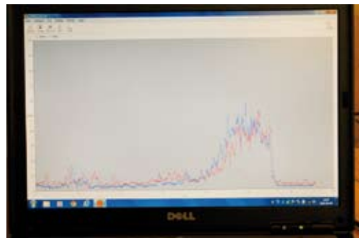
Här kan man se en av Toves skjutkurvor. Ingen tilläggs-spänning när skottet går.

- Det är viktigt att man arbetar lugnt med ungdomar och säger: nu har vi chansen att utveckla din teknik, prova att gör "så här", Det gick inget vidare, hur känner du själv att du vill göra? En dialog är grunden för att lyckas.