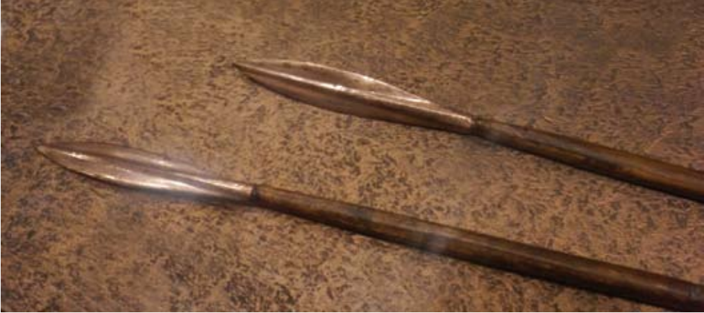
Spetsar från Tutanchamons grav.

så med dessa tidiga representanter för Walsiska bågskytter? Frågor som nog aldrig får något svar, tyvärr.