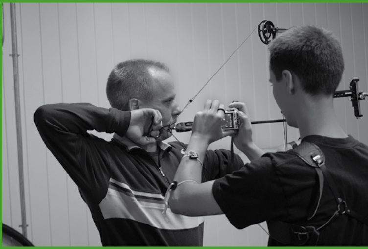
Utan hjälpmedel är det svårt att hinna se något.