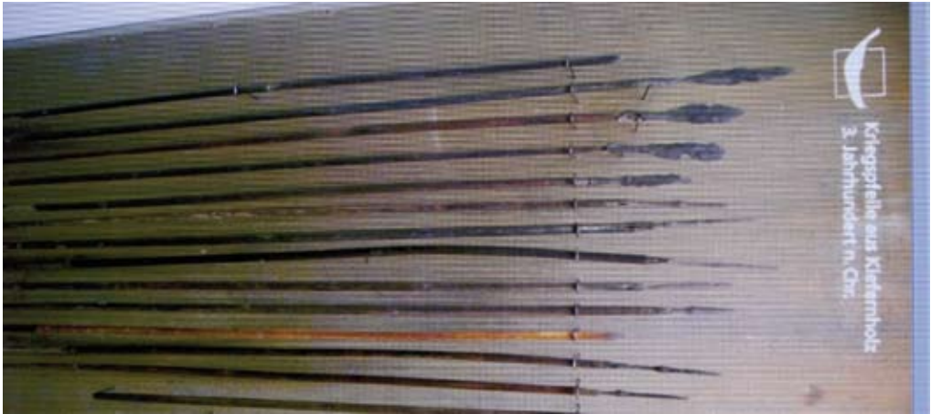
Dom här pilarna är från 300-talet efter Kr.

kroppsskydd. En pil med smal spets har en djupare penetrering. Bågarna och pilarnas roll i striderna har ökat. Vid den här tiden är oftast pilspetsarna oftast försedda med holk för applicering till skaftet. Något som ändras under vikingatid.. Då spetsarna istället börjar mer att föses med tånge. Detta är en tydlig trend som syns i det arkeologiska fyndmaterialet. För den som vill fördjupa sig i detta fenomen med förändrad fastsättning av spetsar på skaft kan jag rekommendera Peter Lindbom ”Pilspetsar från de uppländska båtgravfälten”.