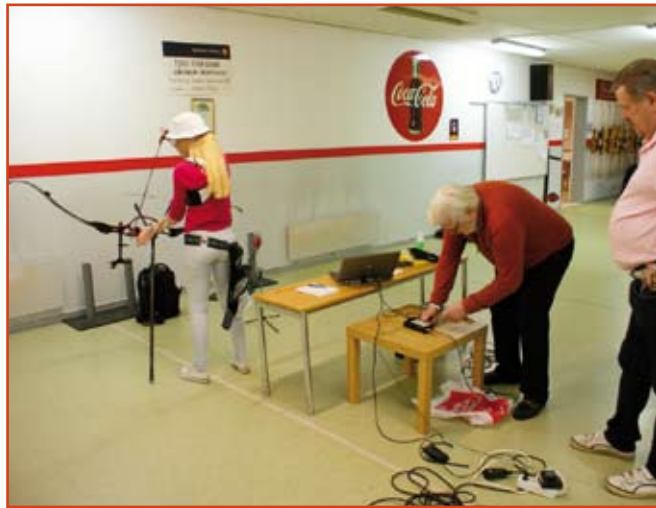
Mätutrustningen består av en liten dosa kopplad till en dator.

- Tove har haft dessa mätresultat som ett rättesnöre och anpassat sin teknik till att vara allt mer avspänd. De första mätningarna gav sämre värden.