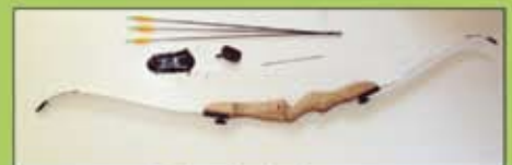
Delar ej utbytbara.