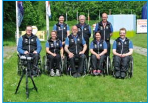
PARA-laget mot Rio.

Vi har en lång väg att vandra för att nå Rio och Paralympics i september.