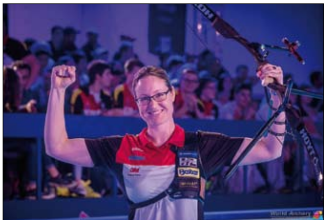
Lisa Unruh, GER

D en tyska Världscup segraren inomhus från 2012 och tillika lagsilver medaljören från inne-VM i Turkiet 2007 Lisa Unruh (damer recurve) kunde inte ha startat detta VM bättre. I grunden klämmer hon till med hela 590. - Jag startade bra och så fortsatte det hela vägen, säger hon stolt efter finalen. Hennes motståndare