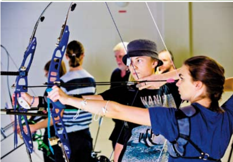
"Årets bästa bilder" av Håkan Lindkvist överst och Gonzalo Irigoyen.