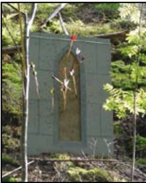
"Fönster". Storlek efter ett i Kungslena kyrka, Västergötland. Foto och tavla av författaren.

röda fältet inte stort. Skjutavstånd 60 meter. Inga fångstnät. Bara den steniga marken. Tuffa vilkor. En rund tavla erbjuder ju "pil-fång" utanför vår gula högsta poängpunkt. Det tänket finns inte med här. Här är det istället så att ett visst strategiskt tänkande går in i skjutvilkoren. 1. Hålla mer i mitten och minska risken att få nollpoängpilar. 2. is i magen och hålla på rött Med högre poäng vid träff. Här gäller det att vara objektiv i sin bedömning av skjutförmågan. Roligt. I Colchester går en bågskyttetävling varje år med inovativa målbyggare. Bland annat skall skytten för att nå ett av målen passera en smal öppning på ca 12 cm bredd. I Tyskland finns en variant med 3 sådana öppningar i rad. Skärmarna med öppningar står ca 3 meter ifrån varandra.