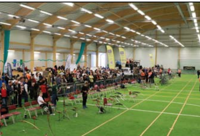
Junior SM i Timrå samlade 269 skyttar.

TEXT: MIKAEL SVAHN