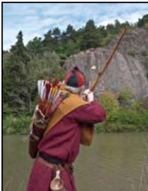
Det obarmhjärtiga målet, av "Yngve Trött".

- Ultimat utmaning. Det är få som kan motstå detta mål på bergväggen, uppskattningsvis 80-100 meter bort. Det ger ingen poäng i själva tävlingen. Målet utgör en egen tävling i sig. Det som kittlar lusten att skjuta är väl just att det är svårt och priset är högt. En miss betyder att pilen splittras mot bergväggen. Det är en del av begivenheterna på Söderköpings Gästabud. En bågskyttehelg av en art som lockar folk från både vårt eget land som utomlands. Rekommenderas, antingen som deltagare eller åskådare. Underhållande. Här ställs krav på både tanke och skicklighet.