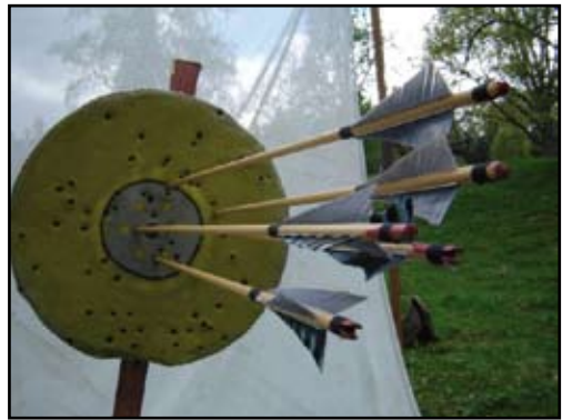
Mål och foto av författaren.

- Balansmål. För grupper, för 2 skyttar eller bara du själv. Har gjort sådana mål över 20 år och spridit dem över Sverige och Norge. Uppskattade. Funktionen ger sig själv. 1 pil i en av tavlorna, sänker denna. 1 i var tavla ger balans igen. Oftast utgörs tävlingsmomentet av att ett i förväg bestämt antal pilar får skjutas. Här finns också utrymme för ett strategiskt tänkande tillsammans med nervkontroll och träffsäkerhet. Tavlorna höjs och sänks hela tiden under skjutningen.