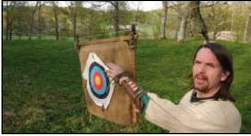
Mål och foto av författaren.

- Glidmål. Ytterligare ett rörligt mål. Den här gången på vajerbana. Här får det som nämns ibland som det intuitiva skyttet något att bita i. Den som har erfarenheter från lerduveskytte känner nog igen sig här. Att kunna beräkna pilbana och hastighet i förhållande till tavlans rörelse.