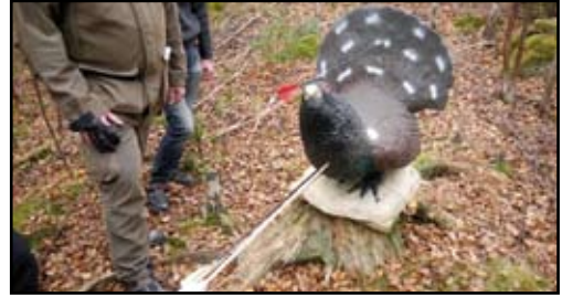
Mål av Forest Archery Camp Sweden.

- 3D-skytte. En av alla kända skytteformer. Men den innehåller så mycket förutom skjutögonblicket. Den sociala samvaron, att få röra på sig mellan målen, naturen. Man får mycket på köpet.