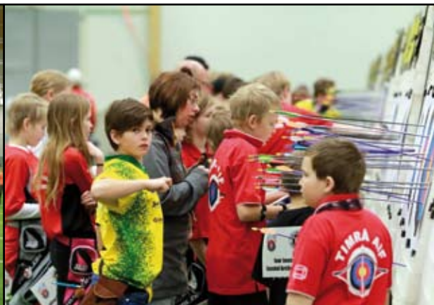
I 10-klasserna var det stundtals riktigt spännande och vilken kämpaglöd vi fick se.

Till Timrå och NCC-hallen anlände undertecknad med Järnvägens BK och Hallsbergsbuss på fredagskvällen. Incheckning och avlastning av SBF-Shopen stod på programmet. 269 skyttar med föräldrar och ledare hade också letat sig fram. Något som arrangören säkert var nöjda med då förra årets JSM drog 225 deltagare. Som vanligt stod ungdomarna för fina insatser och lagtävlingen blev en riktig "nagelbitare". I R16 stod Stockholms BS för en riktig viljeinsats när man besegrar Angered, inte minst för sin avslutande särskjutningsbingo.