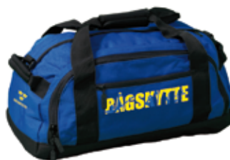
TEAM-väska 50 L 390 kr 30 L 360 kr

- Sedan har vi en hel massa företagsskjutningar också vilket är bra för föreningen, inte bara ekonomiskt utan även så att många kommer tillbaka med sina familjer när man fått prova på via jobbet.