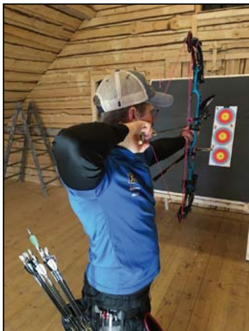
”Bra grunder är allt”

med under en tävling. Detta för att reda ut scenarion och bestämma var det gick snett eller vad som var bra samt såklart återkoppla och utvärdera. I nio fall av 10 är det ett förtroende i skottet eller självsäkerhet som går snett men många gånger pga olika anledningar.