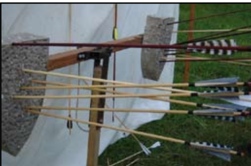
Mål och foto av författaren.

- Balansmål. För grupper, för 2 skyttar eller bara du själv. Har gjort sådana mål över 20 år och spridit dem över Sverige och Norge. Uppskattade. Funktionen ger sig själv. 1 pil i en av tavlorna, sänker denna. 1 i var tavla ger balans igen. Oftast utgörs tävlingsmomentet av att ett i förväg bestämt antal pilar får skjutas. Här finns också utrymme för ett strategiskt tänkande tillsammans med nervkontroll och träffsäkerhet. Tavlorna höjs och sänks hela tiden under skjutningen.