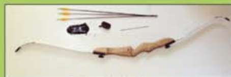
Delar ej utbytbara.