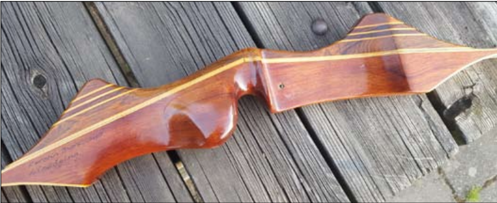
Äldre hel träbåge, ingen Björnbåge dock möjligen en Daimond Howard.

från det att alla sköt rekurv till dess att nästan alla sköt compound.