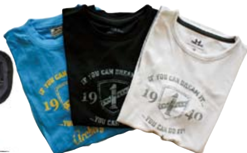
Funktions T-shirt 270 kr