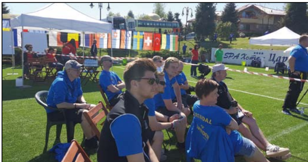
Det svenska laget gjorde en mycket fin insats och det lovar gott inför framtiden.