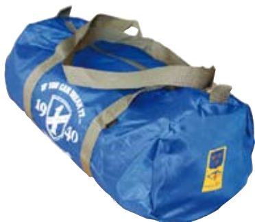
Clubväska 200 kr