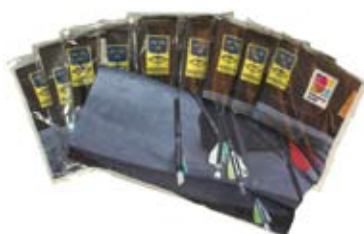
Multiwear 50 kr