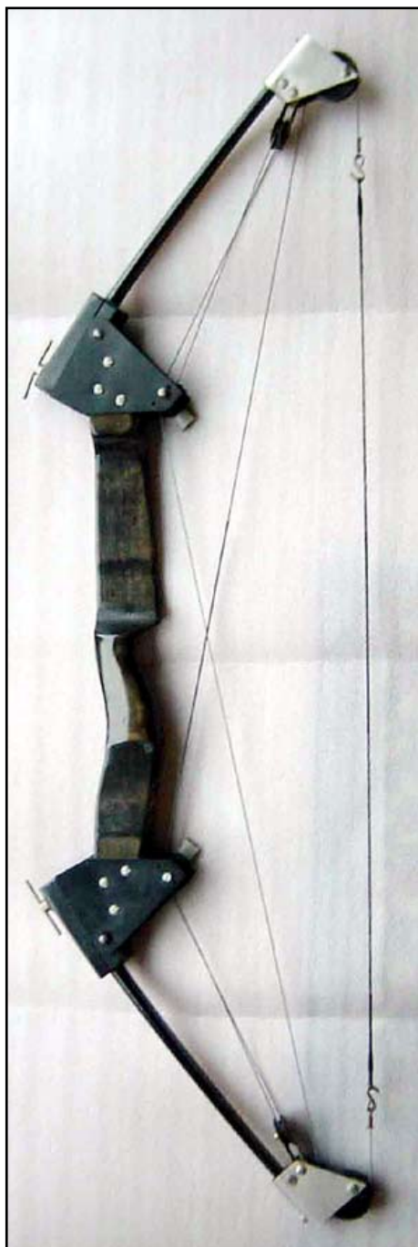
Design: Wilbur Allen

Till en början tyckte man att det var en kul liten leksak men motståndet växte. Men efter 10 år hade den ritat om hela bågskyttevärlden, i alla fall den amerikanska.