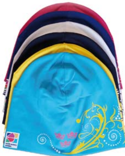
Nya mössor 140 kr