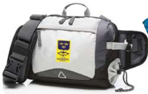
Midjeväska grå 390 kr