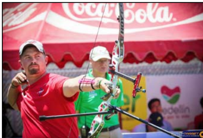
Brady Ellison, USA.