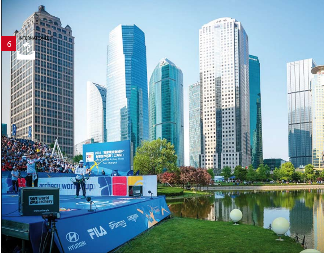
Vy från tävlingarna i Shanghai.