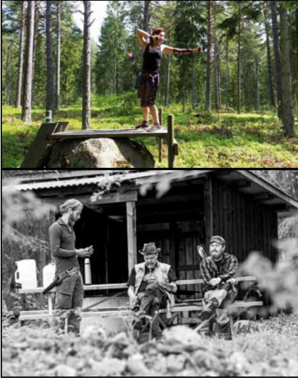
Tumgrepp överst och lite social samvaro.

som med sina anekdoter från många jakt-tillfällen i olika länder berättade om sina erfarenheter.