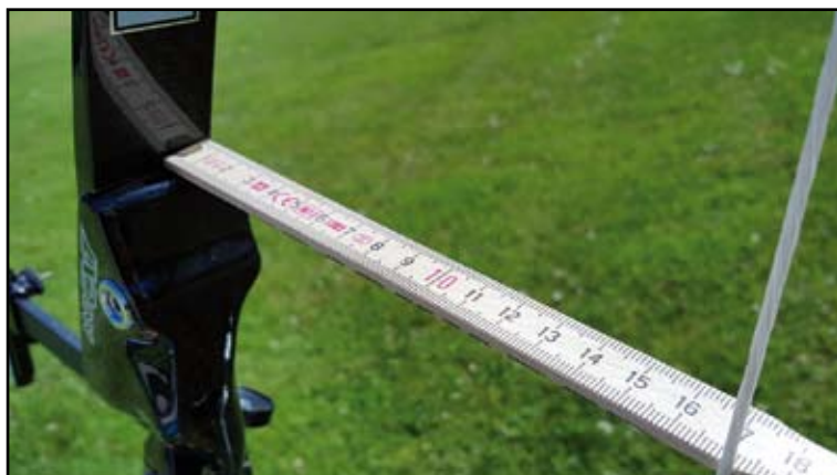
Tillermåttet mäts som det övre minus det undre.

- Motivet till denna skillnad är att skytten drar mer i underlemman, eftersom båghanden och draghanden båda befinner sig un-