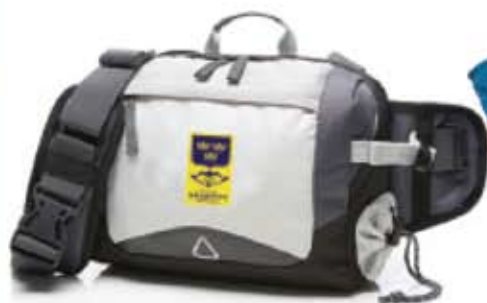
Midjeväska grå 390 kr