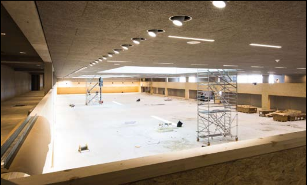
Hela komplexet värms upp av bergvärme. Elen producerar man på taket med solpaneler.

Ambitionen är att centret skall vara helt klart och fullt i gång under 2017 som en multisportarena. Redan nu är vissa delar i-gång och 90-metersbanan väntas tas i bruk i oktober. Ett avtal har ingåtts med innebandysporten som föddes i Sverige på 60-talet och är stort även i Schweiz.