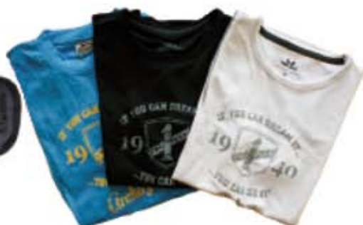
Funktions T-shirt 270 kr