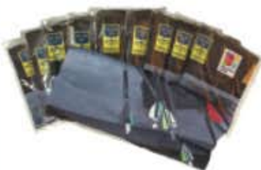
Multiwear 50 kr