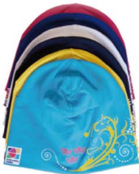
Nya mössor 140 kr