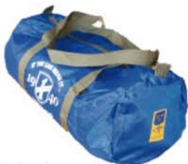
Clubväska 200 kr