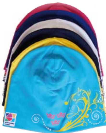
Nya mössor 140 kr