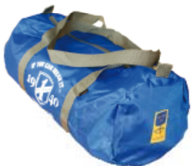
Clubväska 200 kr