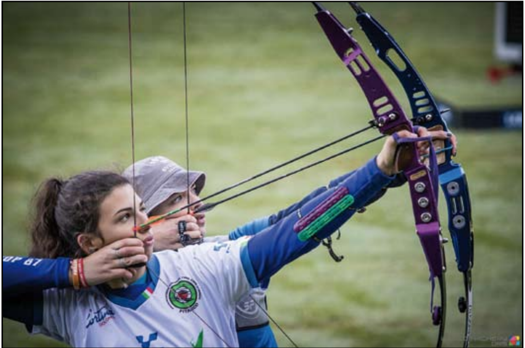
Man lärde sig att titta på målet och känna efter att man siktade rätt.