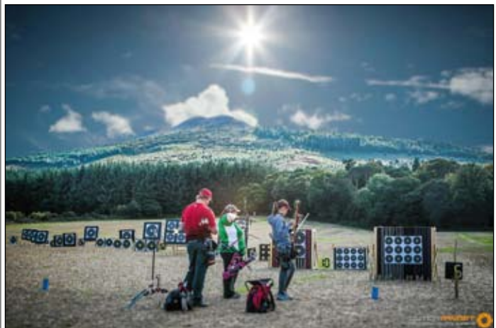
Från Fält-VM på Irland.