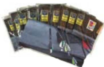
Multiwear 50 kr