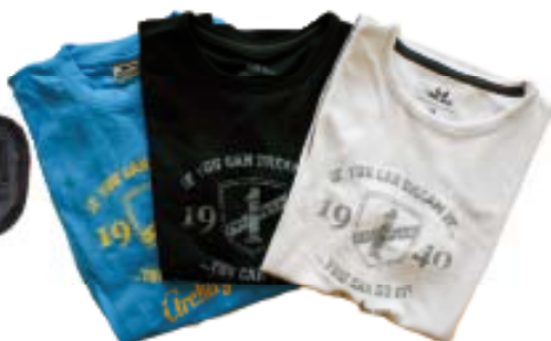
Funktions T-shirt 270 kr