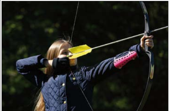
Från Jakt-SM på Taxinge slott.