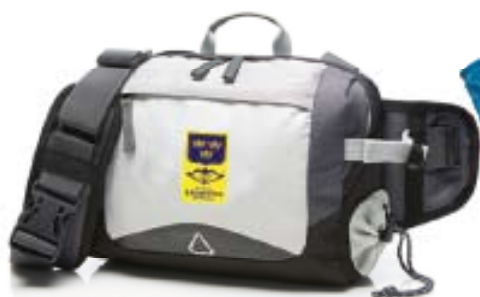
Midjeväska grå 390 kr