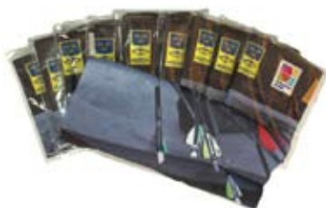
Multiwear 50 kr