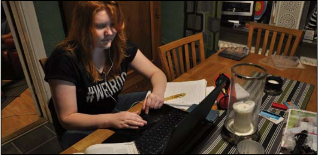
Studierna upptar en stor del av Moas tid.

av den ångest som klättrade uppför ryggraden som jag kommer ihåg mest.