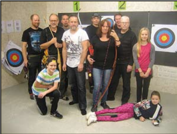
Här syns en del av föreningens medlemmar.

lika stor lokal med tillhörande kök och toalett.