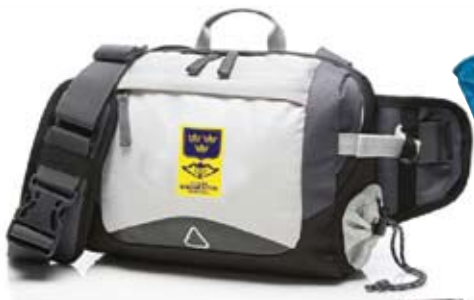
Midjeväska grå 390 kr