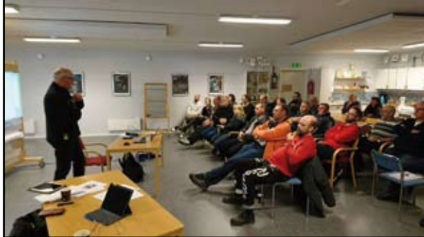
Bilden är tagen vid konferensen i Timrå.

- Sammanlagt har det varit mellan 150 och 200 deltagare, vilket styrelsen måste vara nöjd med. Självklart hade det varit glädjande med ytterligare några fler mötesdeltagare