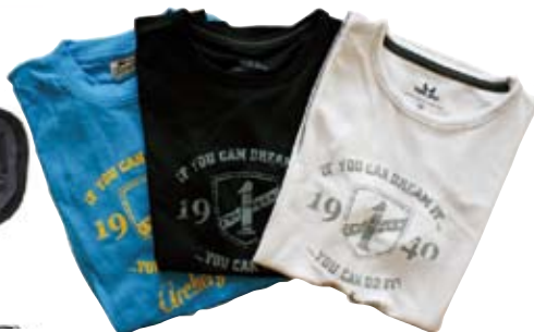
Funktions T-shirt 270 kr